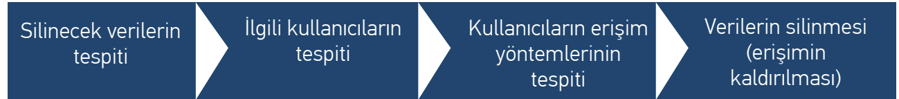
Şekil 2.1. Kişisel Verilerin Silinmesi Süreci