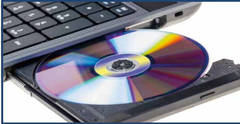
Resim 2.4. Okuma Yazma

iii) Üzerine Yazma: Manyetik medya ve yeniden yazılabilir optik medya üzerine en az yedi kez 0 ve 1'lerden oluşan rastgele veriler yazarak eski verinin kurtarılmasının önüne geçilmesi işlemidir. Bu işlem özel yazılımlar kullanılarak yapılmaktadır.