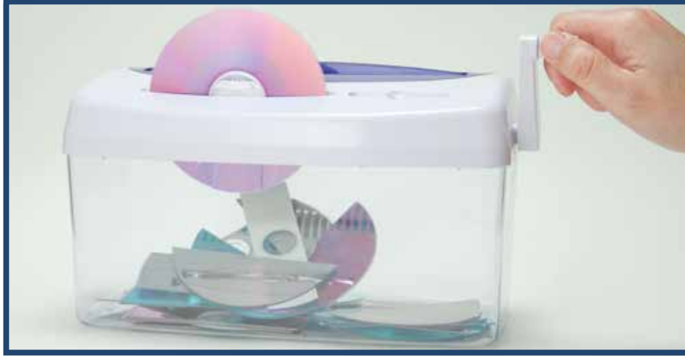
Resim 2.3. Fiziksel Yok Etme

iii) Üzerine Yazma: Manyetik medya ve yeniden yazılabilir optik medya üzerine en az yedi kez 0 ve 1'lerden oluşan rastgele veriler yazarak eski verinin kurtarılmasının önüne geçilmesi işlemidir. Bu işlem özel yazılımlar kullanılarak yapılmaktadır.